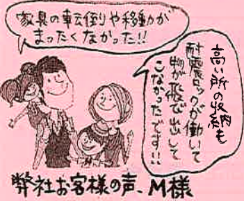
弊社お客様の声 M様

私達は家づくりに不安なお客様に寄り添い、一人一人の想いに 応えながら全力でサポート致します!!