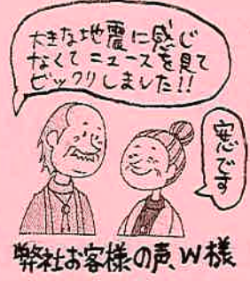
弊社お客様の声 W様